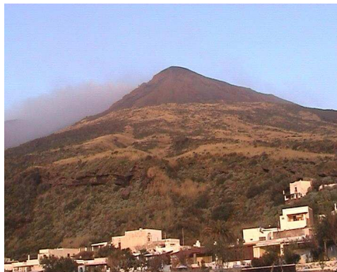
Abbildung 2: Der Vulkan „Stromboli“

Die in der Arbeit vorkommenden Abbildungen und Tabellen werden im Text mit laufenden Nummern und einer kurzen Beschreibung versehen.