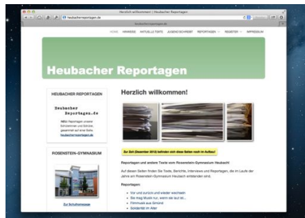
Auf der Internetseite www.heubacherreportagen.de finden sich zahlreiche Texte junger Autoren vom RSG