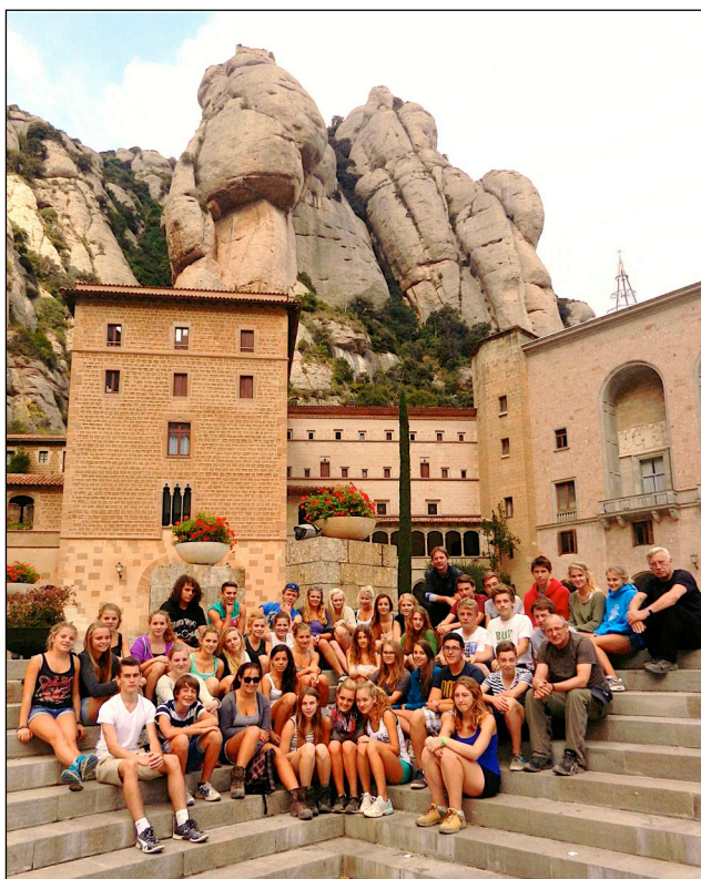
Die Schüler der Spanisch-Klassen der Stufe 10 des Rosenstein-Gymnasiums auf dem Vorplatz des Klosters Montserrat.

Zwischen den anstrengenden Exkursionen war der Tagesausflug nach Barcelona herzlich willkommen und sicher einer der Höhepunkte der Reise. Dort besuchte man die Sagrada Familia, das Wahrzeichen Barcelonas, und auch den Parc Güell, beides