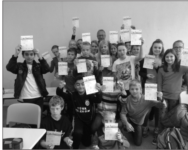
Begeistert zeigen Schüler des Rosenstein-Gymnasiums Heubach Ihre Urkunden zur Erringung des „Deutschen Sportabzeichen“ bei der Feierstunde des Heubacher Gymnasiums.

Künftig wird dieses Abzeichen für alle Schüler der Klassen 5 bis 10 am Heubacher Gymnasium angeboten werden. In einer Pilotphase, im vergangenen Schuljahr 2014/15, haben unter der Federführung des Sportlehrers Simon Challier zwei Klassen des Rosenstein-Gymnasiums im Rahmen des Sportunterrichts das „Deutsche Sportabzeichen“ abgelegt. Hierbei mussten die