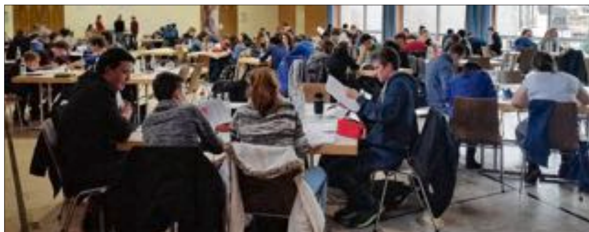
Rund 100 Teilnehmer aus ganz Baden-Württemberg beim „Tag der Kombinatorik“