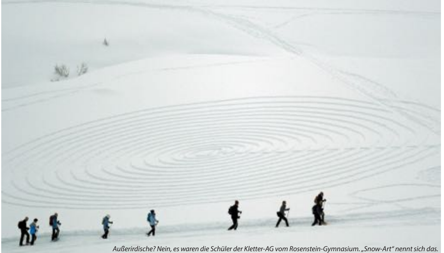
Außerirdische? Nein, es waren die Schüler der Kletter-AG vom Rosenstein-Gymnasium. „Snow-Art“ nennt sich das.

Die Kletter-AG auf der Schwarzwasserhütte im österreichischen Kleinwalsertal.