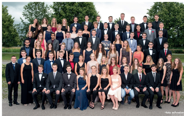
Abiturball Rosenstein Gymnasium 2016

74 Schülerinnen und Schüler des Rosenstein-Gymnasiums in Heubach freuen sich über das bestandene Abitur. Zahlreiche Schülerinnen und Schüler erreichten Preise (Pr.) oder Belobungen (Bel.) oder erhielten einen der begehrten Sonderpreise für hervorragende Leistungen.