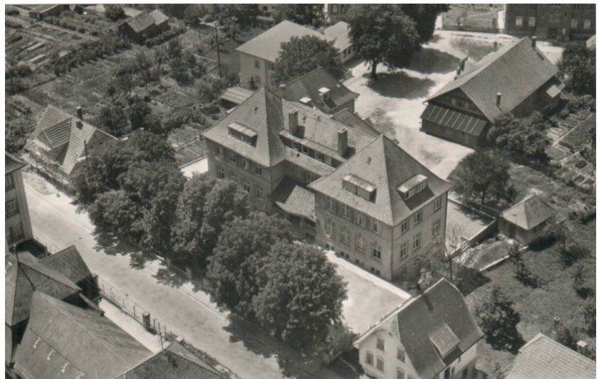
Im Zuge der Vorbereitung des Projekts „Geschichte des Rosenstein-Gymnasiums“ wurde dieses Foto unseres Altbaus, welches wir unseren Leserinnen und Lesern nicht vorenthalten wollten, aufgefunden. Die genaue Datierung ist unbekannt.

Andererseits wird die Individualisierung und damit einhergehend die Vereinsamung auch durch die Ökonomie gefördert. Unsere Welt ist sehr verzweckt worden. Der Zweck heiligt vermeintlich die Mittel. Mehr denn je