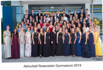
Abiturball Rosenstein Gymnasium 2019

Abitur 2019 am Rosenstein-Gymnasium Heubach: Die Liste mit den Namen unserer Abiturientinnen und Abiturienten SEITE 2